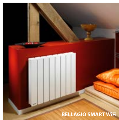
BELLGIO SMART WIFI