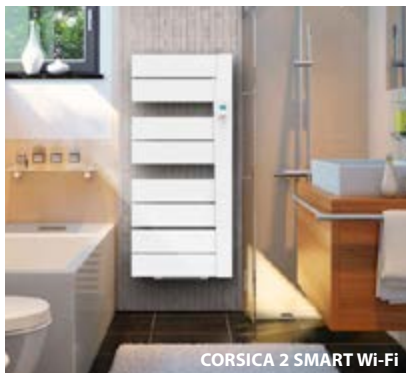
CORSICA 2 SMART Wi-Fi