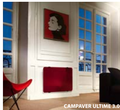
CAMP AVER ULTIME 3.0